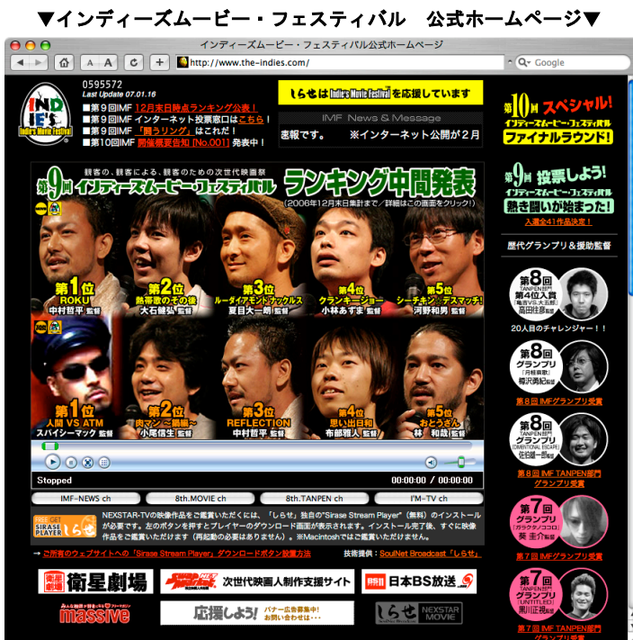
▼公式ホームページへの「HIT (訪問) 数」実績▼

年間合計: 7,891,576 HIT 月間平均: 657,631 HIT 1日平均: 21,620 HIT